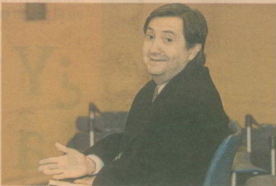
Federico Jiménez Losantos.