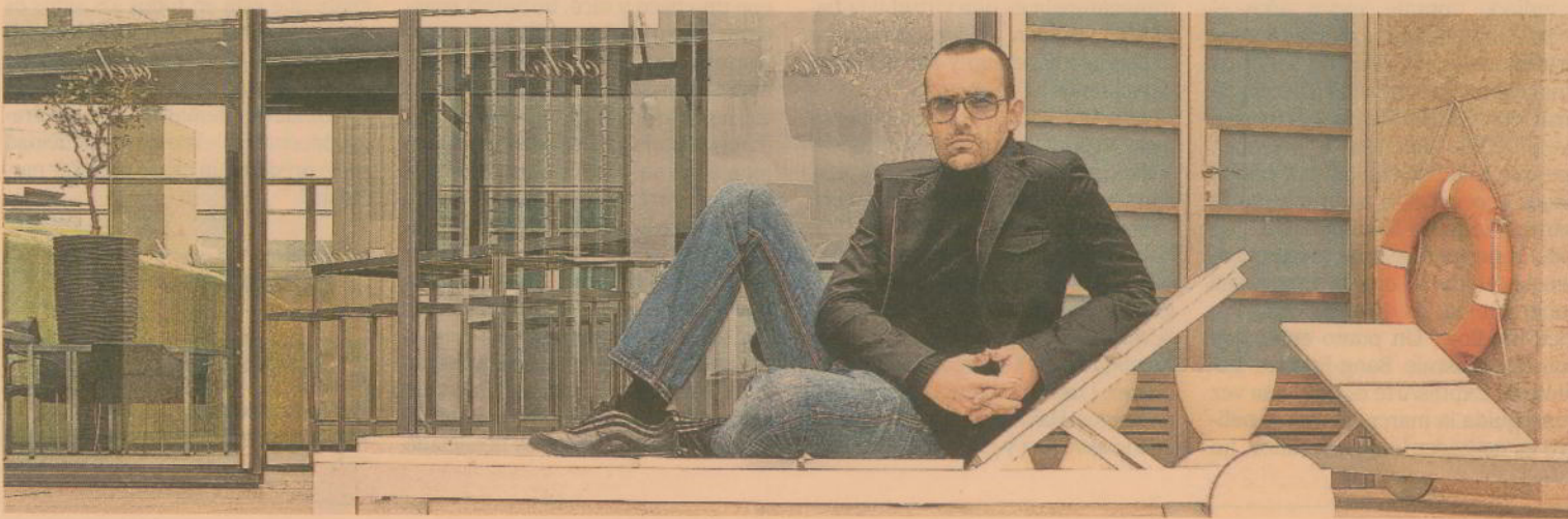
Risto Mejide ha forjado su imagen a través de sus duras críticas que siempre crean polémica.